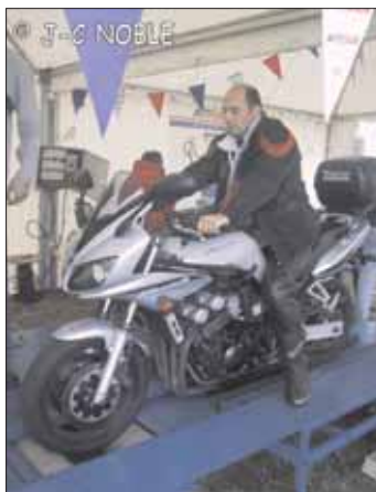
La Fazer de J-C sur le banc d'essai lui confirme que tout est OK

Un binôme de la C.R.S. 37 était aussi présent, une flopée de photos d'accidents a fait beaucoup réfléchir les quelques motards présents. Après une journée bien remplie, nos deux I.D.S.R. rentraient une fois de plus en pensant avoir accompli leur mission.