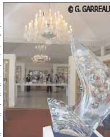
Le magasin éclatant des lumières cristallines de Baccarat

Vers 15h30, il nous reste juste le temps de rejoindre Strasbourg par Raon l'Etape, le col de Saales, le col d'Urbeis,