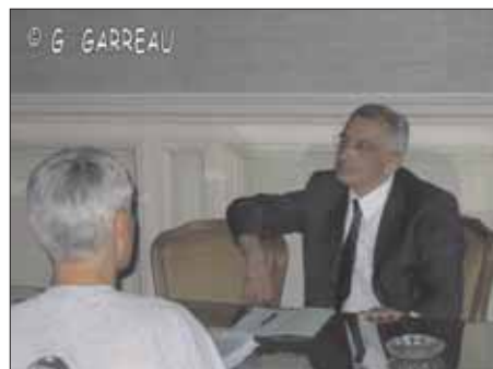
Le président de la FFMC 67 expliquant les dangers de la mesure sur l'allumage des feux de jour au Préfet

Le Président de la FFMC 67 démontre que cette revendication a été au préalable étu-