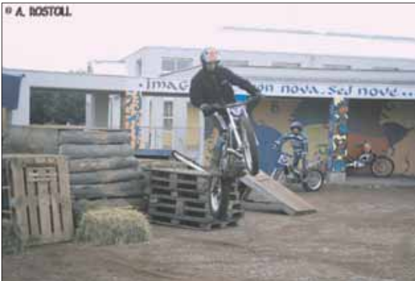
Un millier de visiteurs a pu assister aux exercices de style de cette discipline difficile qu'est le trial.

En cette journée du 26 septembre, le Moto Club de Rhinau avait organisé un salon de la moto. Différents stands étaient présents : celui du MC de Rhinau bien entendu, de la FFMC,