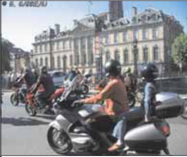
Les manifestants sont passés devant le Palais des Rohan sous les applaudissements des piétons.

Chaque motard a pu déposer sa signature sur la pétition, faire un don symbolique à la FFMC et recevoir en échange un auto-